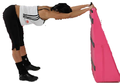
Posizione a L