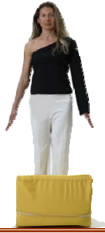
Montagna Stabile e Immobile