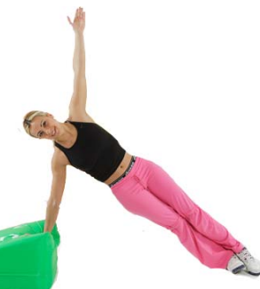
Side Plank II