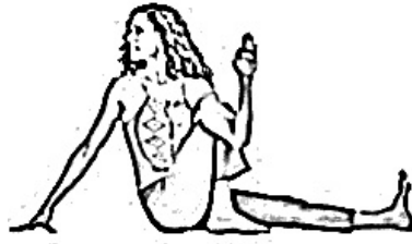
Re dei Pesci