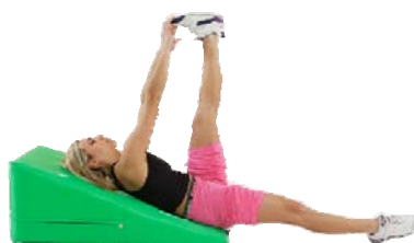
Alluce Afferrato Distesa