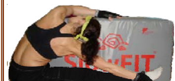
Flessione Laterale Seduta Testa-Ginocchio