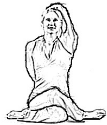
Muso di Vacca