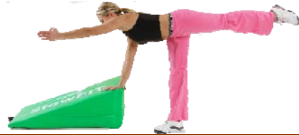
Guerriero III supportato