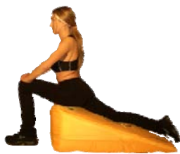
Affondo in ginocchio