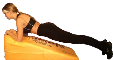
Plank sui gomiti