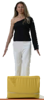
Montagna Stabile e Immobile